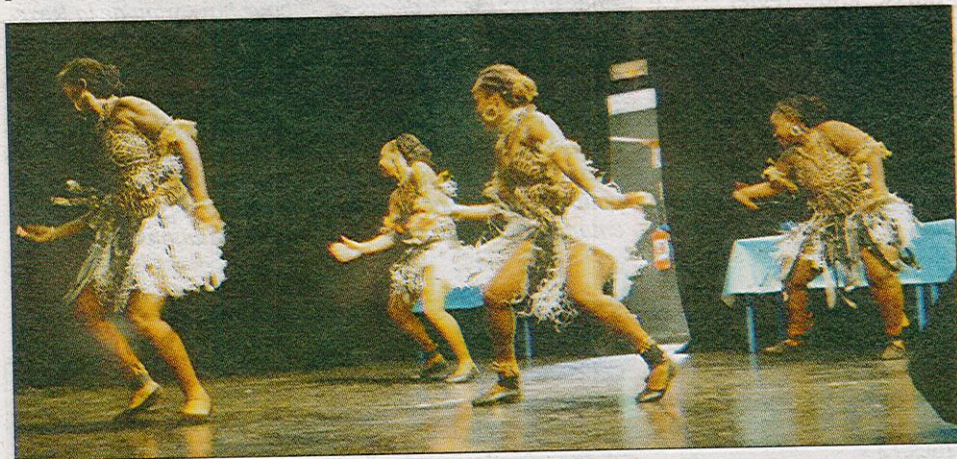
La cérémonie a été ponctuée par des danses.