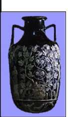
Amphore pour huile

Les vins ne sont pas de très grande qualité, La gamme est cependant très variée: vins aromatisés (à la myrte, à la cannelle, au safran), vins médicinaux (mélange de vin et de miel).