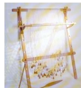
Métier à tisser.