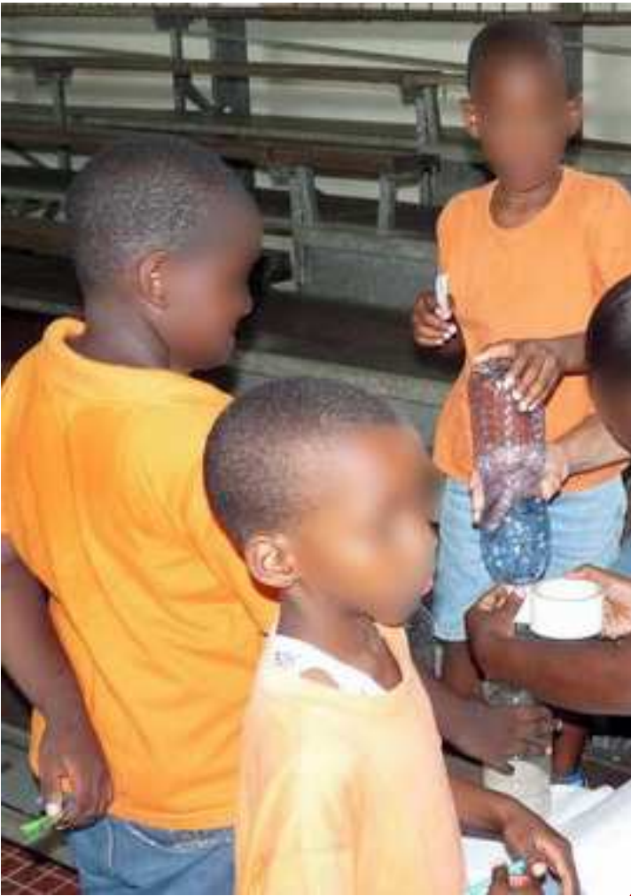
Atelier 3 : assemblage des deux bouteilles avec du scotch