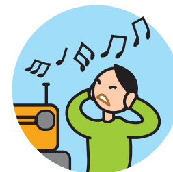
Peut être hypersensible aux sons, aux odeurs ...