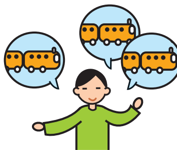
Parle de façon incessante sur un sujet particulier