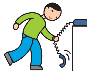
Utilise les objets de façon atypique