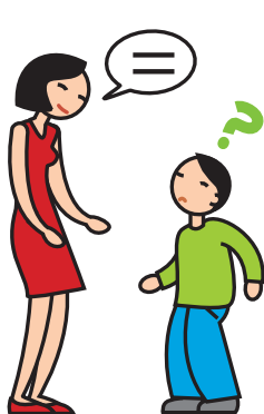
A du mal à comprendre et à se faire comprendre