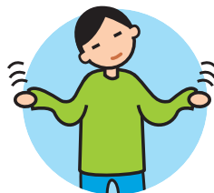
Présente des comportements bizarres