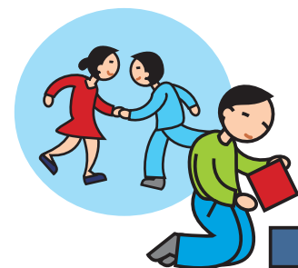
Ne joue pas avec les autres enfants