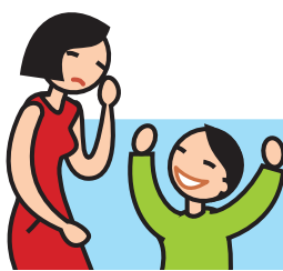
Rit de façon inappropriée