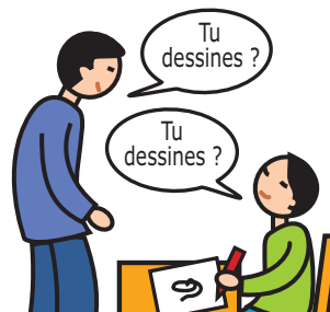
Utilise le langage de façon écholalique