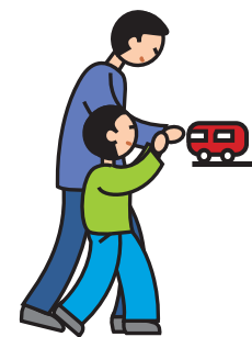
Indique ses besoins en utilisant la main d'un adulte