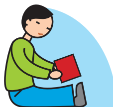
Manque de jeux imaginatifs