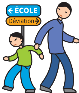
N'apprécie pas les changements