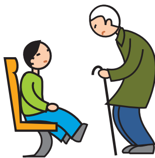
Comprend mal les conventions et les règles sociales