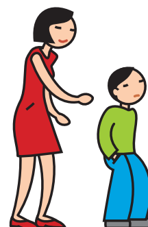
Manifeste de l'indifférence